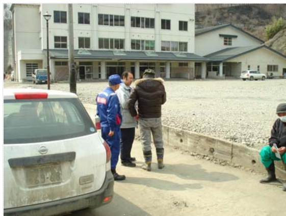
土工協との現地打合せ状況 (3/31)