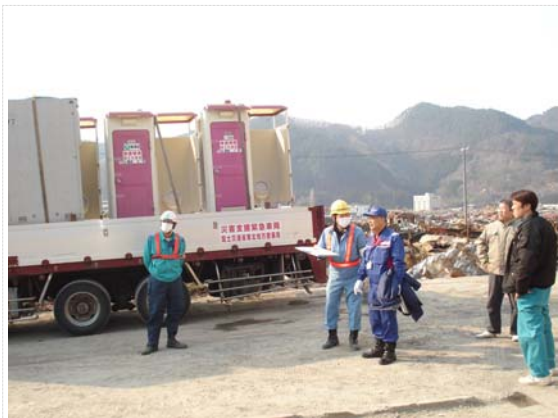
仮設トイレ搬入状況 (3/30)