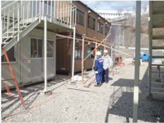
仮庁舎作業工程打合せ (4/3)