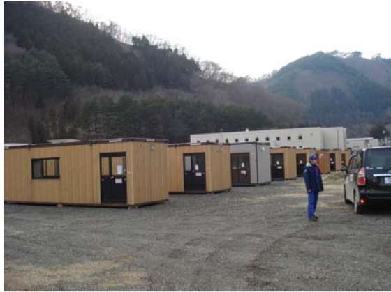
仮設ハウス搬入確認 (3/29)