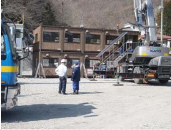
仮設調査設置作業確認 (4/1)