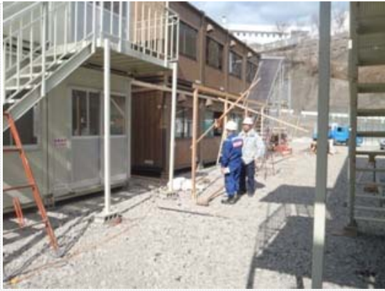
仮庁舎作業工程打合せ (4/3)