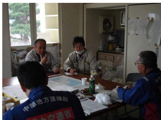
岩手県との打合せ状況 (3/30)