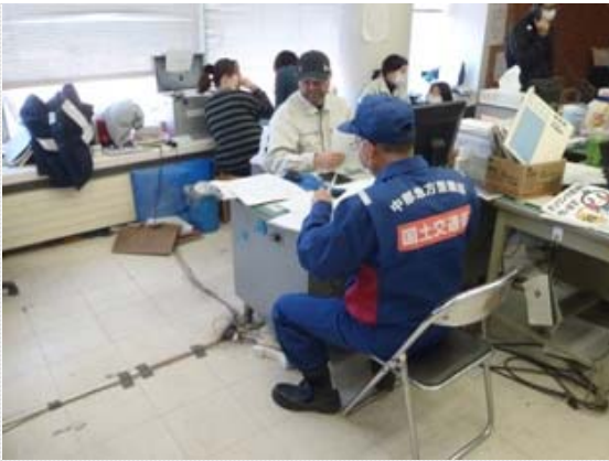
大槌町との打合せ状況 (4/1)