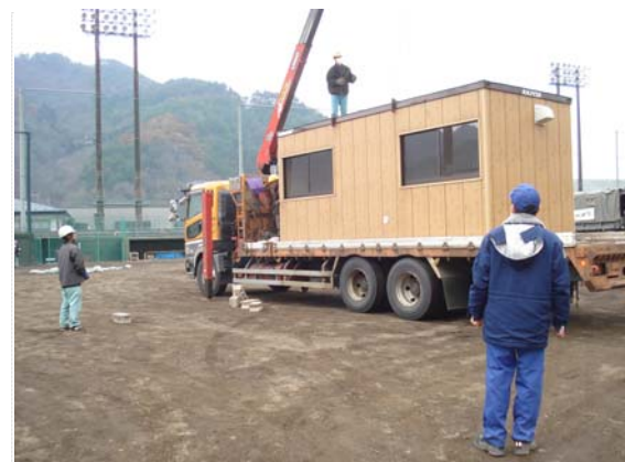
仮設ハウス搬入状況 (3/30)