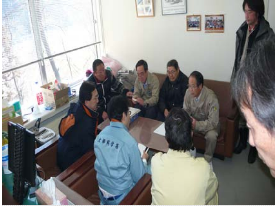
岩手県知事・文科省副大臣（3/28）