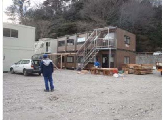
仮調査設置作業状況 (4/3)