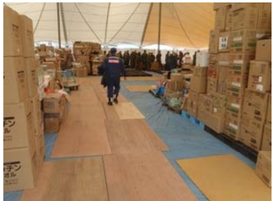
物資集積場コンパネ使用状況 (4/3)