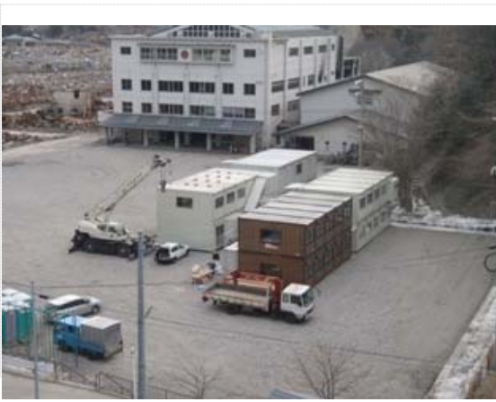
仮調査設置作業終了 (4/3)