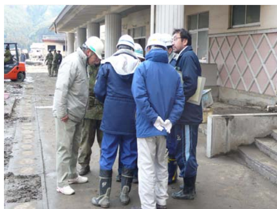
仮庁舎現地打合せ (3/27)