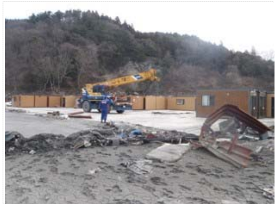
仮置ハウス搬入数量確認 (4/1)