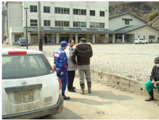
土工協との現地打合せ状況 (3/31)