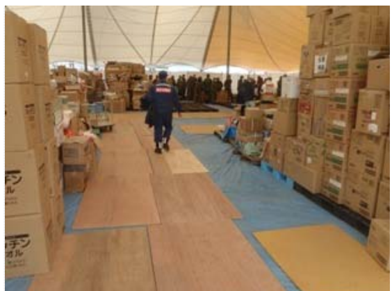
物資集積場コンパネ使用状況 (4/3)