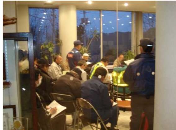
災害対策本部定例会議 (3/29)