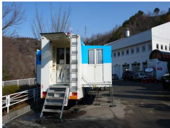
国交省災害対策車 (3/26)