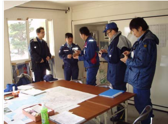
中国地整リエゾン打合せ状況 (3/24)