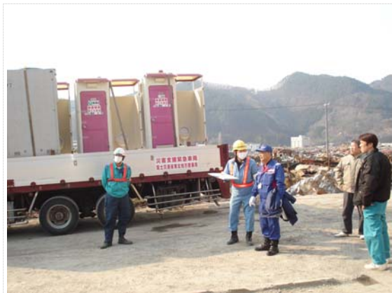
仮設トイレ搬入状況 (3/30)