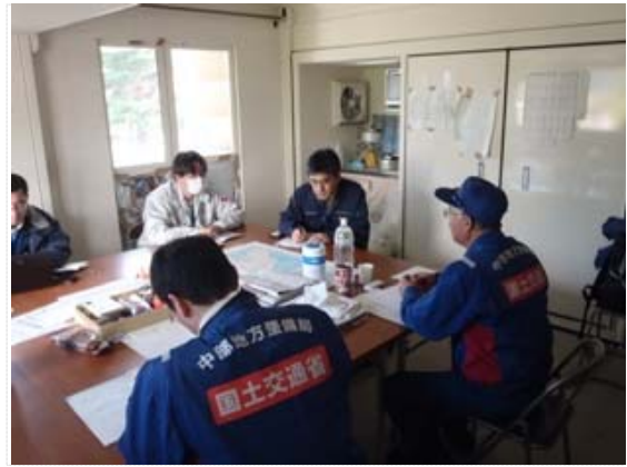
岩手県との打合せ状況 (4/1)