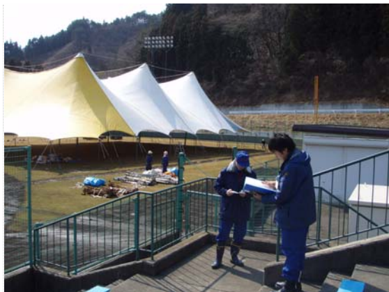
物資保管用テント (3/25)