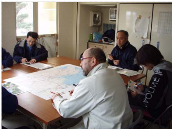
仮庁舎打合せ状況 (3/24)