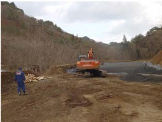
埋葬予定地造成作業状況 (4/2)