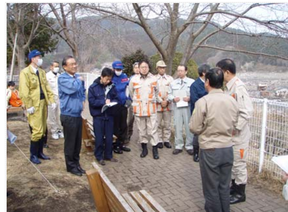
環境政務官視察状況 (3/24)