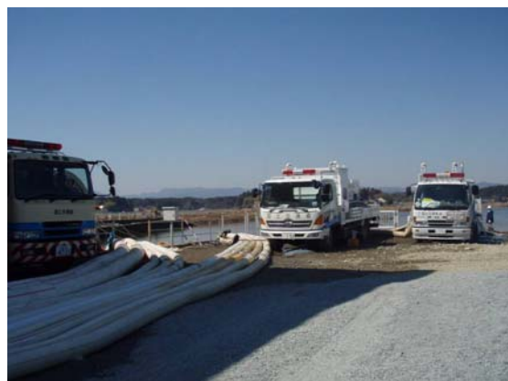
排水ポンプ稼働状況確認 (4/6)