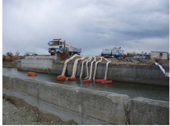
排水ポンプ稼働状況 (4/4)