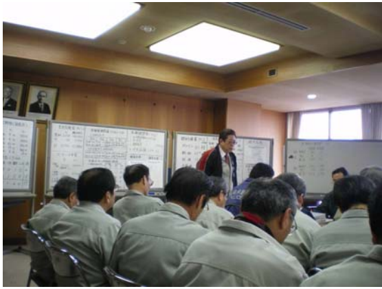
災害対策本部定例会議 (4/1)