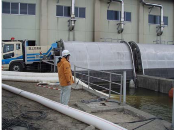
排水ポンプ稼働状況確認 (4/4)